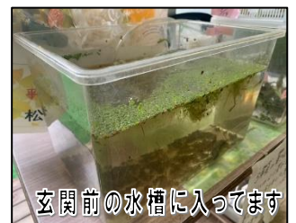
玄関前の水槽に入ってます