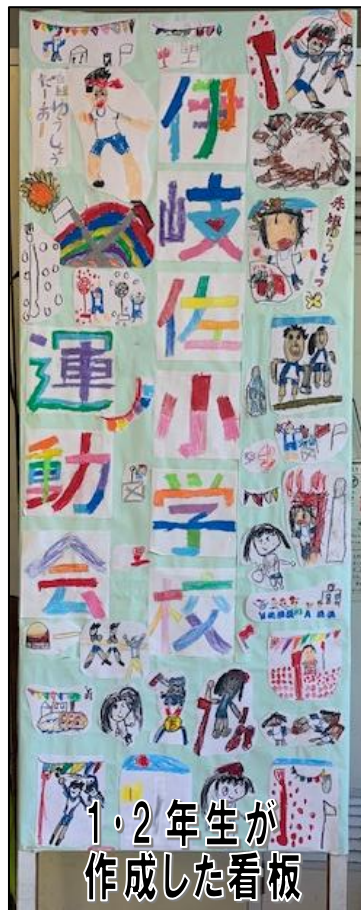
1・2年生が作成した看板

学校には、入学式、始業式・終業式、卒業式、授業参観、避難訓練、修学旅行…の学校行事があります。保護者の皆様も小学校の頃「これ思い出に残っているな～」という学校行事があると思います。その中で、運動会は大人になっても忘れられない思い出の一つだと思います。学校行事は、 学校生活に活気と変化を与えます。 教科学習では十分に発揮できない自分の良さとか、友達の頑張りとかを実感できる場です。力に差がある友達同士協力し、助け合うことが自然とできます。これからのものような直接体験を大切にしていきたいものです。