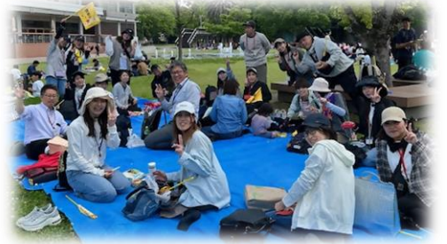
協力いただいた保護者の方々です

また、この日「こころざしの森」までの道中は、保護者の皆さんが駐車場の出入り口や交差点に立ち、子どもたちを見守ってくださいました。その数、総勢55名とのこと。479名の子供たちの遠足を安心安全に行うために、陰で支えていただいたことに感謝申し上げます。本当にありがとうございました。