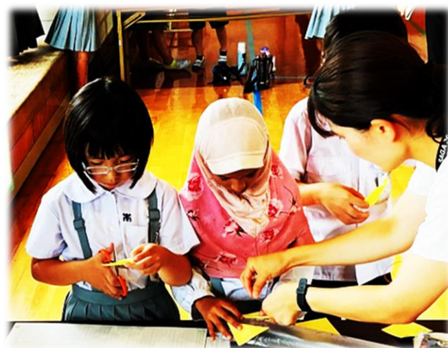
3年理科 「ゴムと風の力のはたらき」