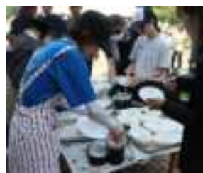
上手く炊けたかな