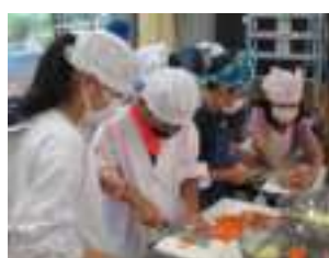
上手く切れるかな！