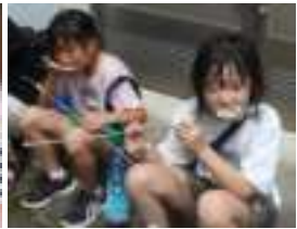
やまめがたくさん! 皆さんおいそー。あれ?さっきカレー食べたよね?

子供たちにとっては、貴重な体験そして楽しい1日だったと思います。大きなけがもなく終わることができ本当によかったと思っております。本行事ができるのも、育友会の役員や保護者の方々、地域の方々のお陰です。ありがとうございます。感謝申し上げます。