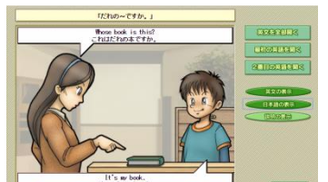
▲英文ごとに繰り返し聞けます