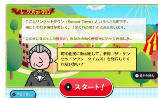
▲家庭での学習履歴が残ります