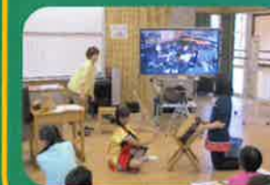
リズモア校との交流