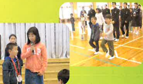
新しい仲間を迎える会