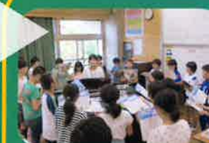
北山東部小との交流