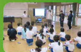
中期ブロック集会