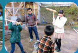
冬の北山まつりでの交流