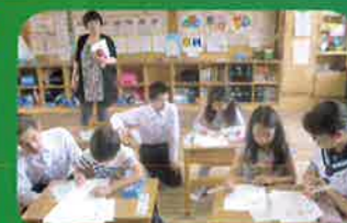
中学生ミニティーチャー