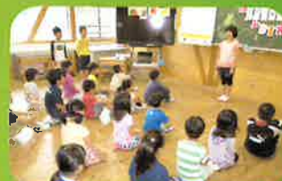
前期ブロック集会