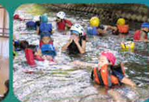
サマーキャンプでの交流