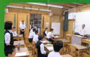
後期ブロック集会