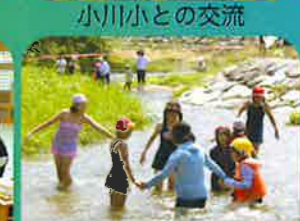
サマーキャンプでの交流