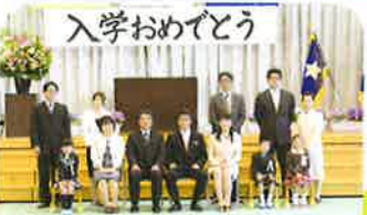
小学部入学式 (入学式は、小中合同開催)