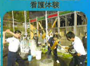
冬の北山まつりでの交流