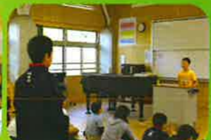
中期ブロック集会