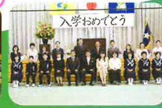
中学部入学式 (入学式は、小中合同開催)