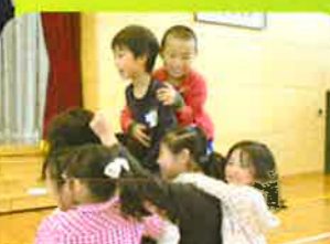
前期ブロック集会