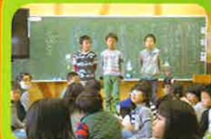
前期ブロック集会