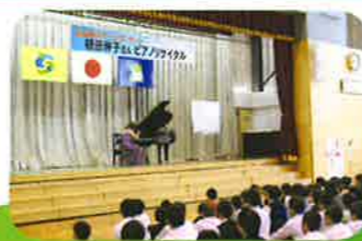
スクールコンサート