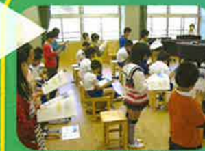
北山東部小との交流