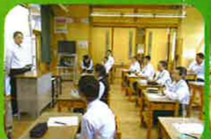
後期ブロック集会