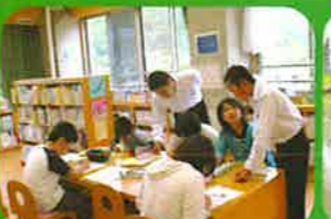
中学生ミニチャリティ