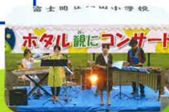
ホテル観にコンサート