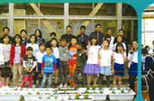
児童生徒会「花苗植え」