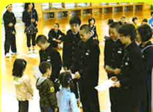
新しい仲間を迎える会