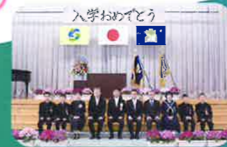
中学部入学式 (入学式は、小中合同開催)