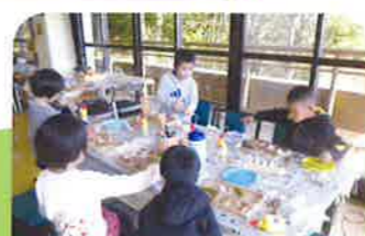
木の実でおもちゃづくり