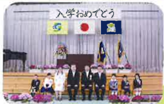
小学部入学式 (入学式は、小中合同開催)