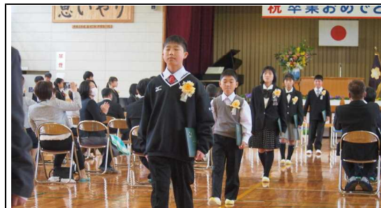
【様々な思いを胸に巣立っていった30名の卒業生】