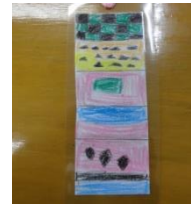
1年くろきあいさん