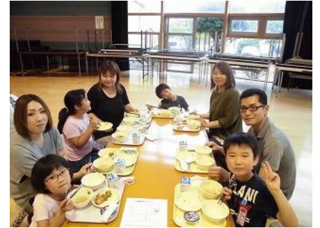
ふれあいホールで、お家の人と1年生全員でおいしい給食を食べました