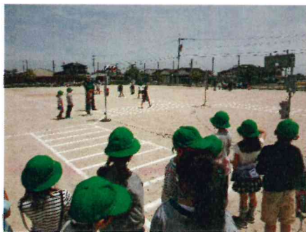
横断歩道で信号が変わるのを待っています