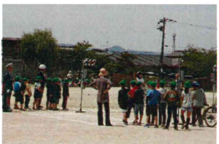
交通ルールを守って安全にね