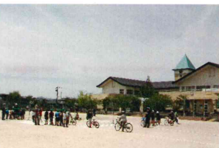
とても良い天気の下で行いました