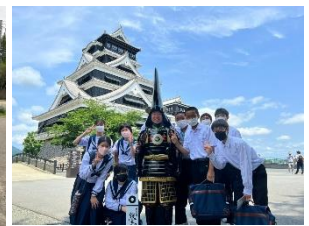
キャリア発達課題 2年校外学習 向かう力・やり抜く力・見つめる力・つなげる力