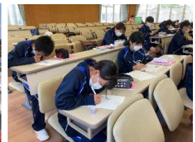
キャリア発達課題 1年校外学習 向かう力・やり抜く力・見つめる力・つなげる力