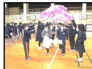
アーチをくぐって退場