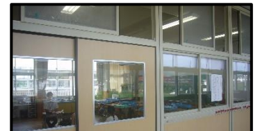
換気(上の窓)と距離の確保