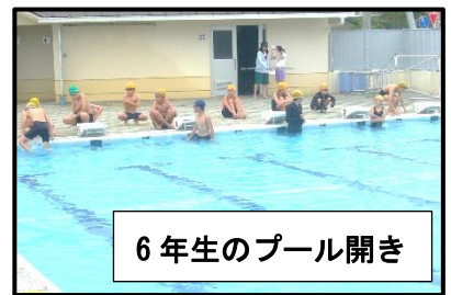
6年生のプール開き

先週から体育の時間にプールでの学習が始まりました。新型コロナウイルス感染症防止の取組として、今年度はプールでの学習を実施しない学校もありますが、本校では、町教委の指導を受け、感染防止の対策を取りながら授業を進めていきます。具体的には、換気ができ、広い図工室を更衣室として使います。また、タオルは、間隔を取ってフェンス等に掛けるようにして個人で管理させ、人のタオルを触らないようにさせています。授業では、多人数が一斉にプールに入らないように、グループを作り、コースを分けたり、ローテーションをしたりしながらの授業になるので、今までとは少し違う形の授業形態になっています。新型コロナウイルスは、塩素で消毒されたプールの水を介して感染することはないと言われていますが、プールでの授業参加に不安がある場合は、学校にご相談ください。例年以上に「安全」に「清潔」にプールを使っていきます。(毎年恒例の夏休み中の学校プールの開放ですが新型コロナウイルス感染症防止の観点から、本年度の夏休み期間中の学校プールの開放は中止します。)