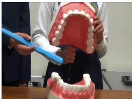
正しい歯のみがき方や歯ブラシの持ち方