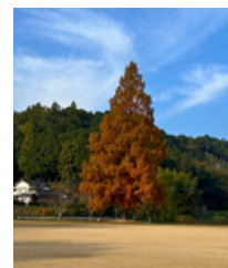
メタセコイアの紅葉

この1か月で秋が深まり、冬の足音が聞かれるようになりました。朝夕冷え込むことが多くなっています。一方で、空気が澄んでいるため、早朝はすがすがしい気持ちになったり、夜の星空や月の美しさを感じたりすることができます。インフルエンザ等の感染症に気を付けながら、初冬の日々を楽しく元気に過ごしてほしいです。