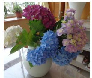
あじさいの季節。学校にもあじさいの花がいっぱいです。

6年生が素敵な言葉を集めてくれました。中央廊下に掲示されています。人の気持ちによりそうことができる東っ子をめざしていますので、このような言葉が自然と言えると素晴らしいと思います。