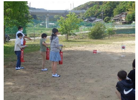
水消火器を使って火に見立てたボードを倒します。