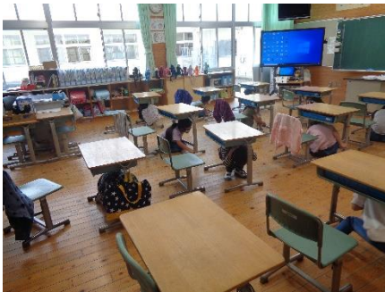
机の下で身を守りました。

5月7日（金）に避難訓練を行いました。これまで、武雄市も大きな災害に見舞われ、避難を余儀なくされた方がたくさんおられました。災害は、いつ起こるかわかりません。いざというときに自分の命は自分で守ることができるように学校でも1年に2回避難訓練を行います。第1回目は、地震・火災の訓練でした。各クラスで緊急地震速報を聞き、まずは、机の下で自分の身を守る行動をとり、その後、給食室から火災も起きたという想定で運動場に避難しました。どの学年も「お・か・し・も」の約束どおり静かに避難することができました。担当の先生からは、水消火器の使い方についても説明があり、代表で6年生が、実際に使い方を練習しました。今後、水害・洪水に対しての防災教室も行う予定にしています。