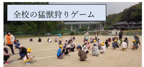
全校の猛獣狩りゲーム