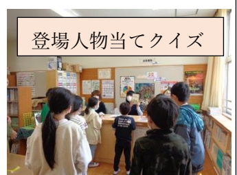
登場人物当てクイズ