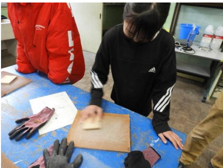
4. 表面の突起を、紙やすりできれいに取り除きます。