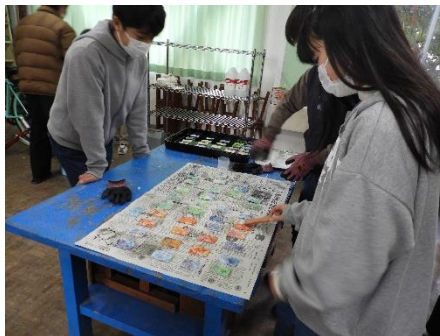
5. つや出しニスで光沢を出して乾かします。