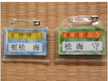
7. 完成した名前札。児童に好きなものを選びせます。