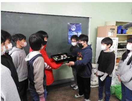
8. 6年生から5年生へ。3月の集会で全校児童へプレゼント。

◆ 本校では定期的に、東の浜の清掃活動を行っています。ゴミ拾いをする 것도大切ですが、ゴミを出さない取り組みも重要です。プラスチックごみ問題は、みんなの意識改革なしには進みません。美しい東唐津を、そして地球を守るために、できることを考え実行していきます。