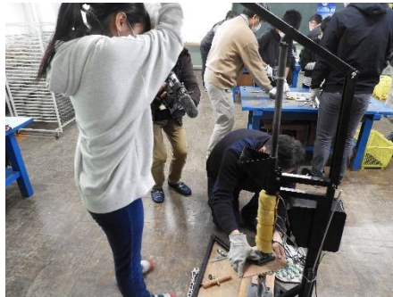
2. 機械に入れて溶かし、金型に注入します。