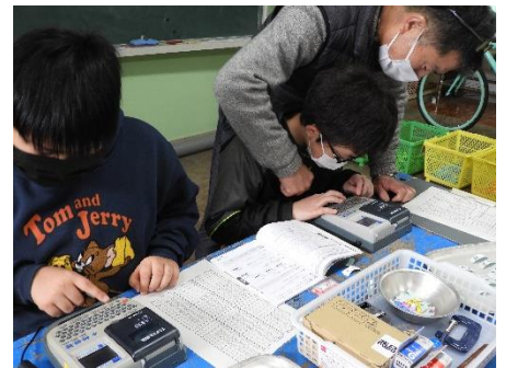
6. 全校児童の名前をテプラーで制作します。