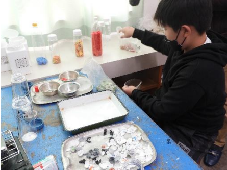
1. 細かく砕いたペットボトルキャップの配合をします。

6年生の卒業プロジェクトと5年生への引継ぎもかねて、5・6年生で在校生の名前札づくりをしました。世界に一つだけのオリジナル名前札、かっこいいですよ！