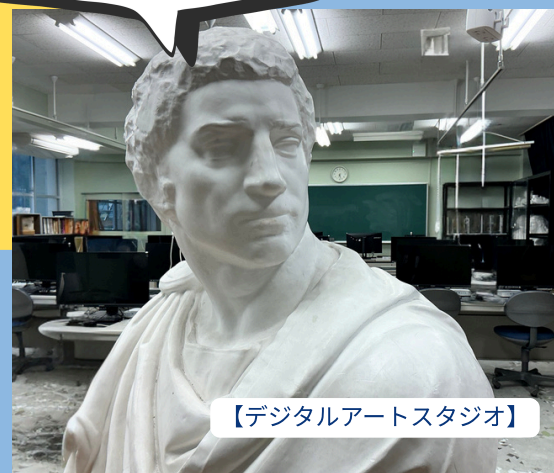
【デジタルアートスタジオ】