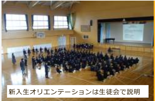
新入生オリエンテーションは生徒会で説明