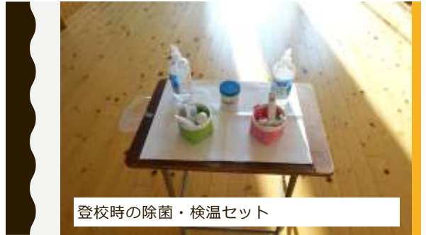
登校時の除菌・検温セット