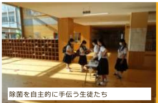
除菌を自主的に手伝う生徒たち