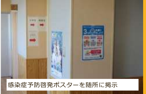
感染症予防啓発ポスターを随所に掲示