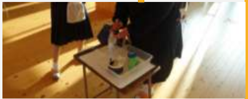
登校時は、除菌するよう指導