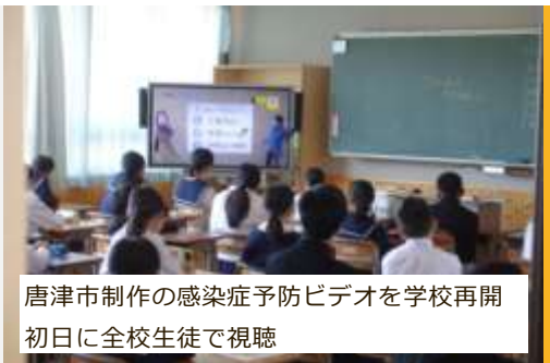
唐津市制作の感染症予防ビデオを学校再開初日に全校生徒で視聴