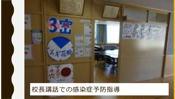
校長講話での感染症予防指導