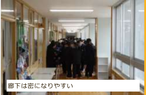
廊下は密になりやすい