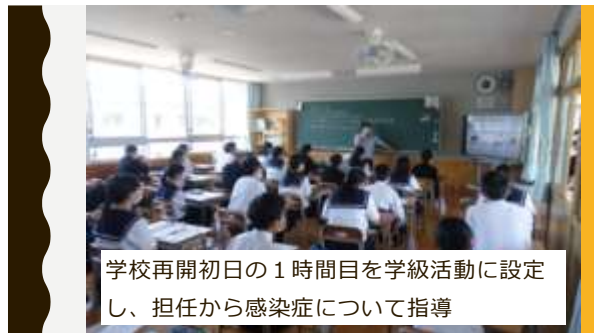
学校再開初日の1時間目を学級活動に設定し、担任から感染症について指導