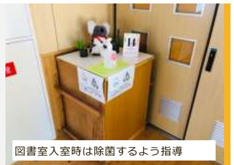
図書室入室時は除菌するよう指導