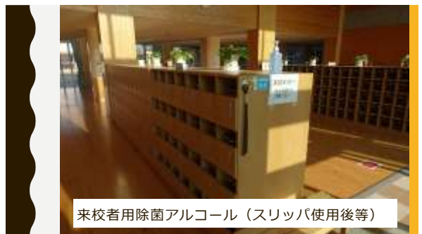
来校者用除菌アルコール（スリッパ使用后等）