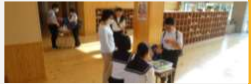
教職員が検温確認と除菌指導