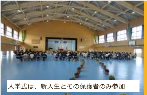
入学式は、新入生とその保護者のみ参加