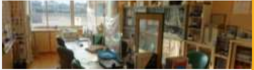
事務室の感染予防シート