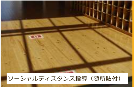
ソーシャルディスタンス指導（随所貼付）