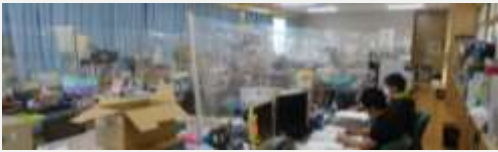
職員室の感染予防シート