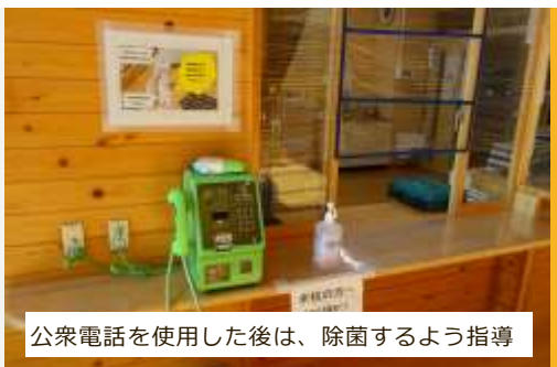
公衆電話を使用した後は、除菌するよう指導