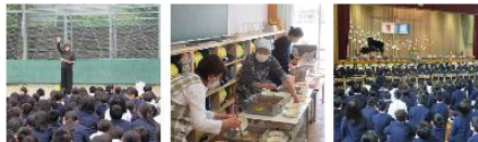
火災避難訓練 1年生給食開始 入学式