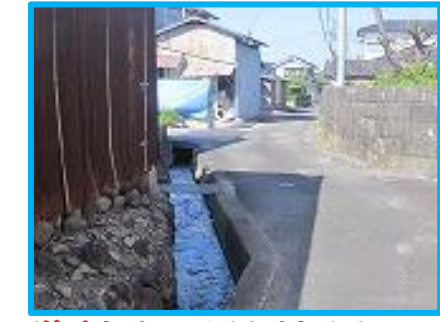
道路わきの小川があふれる