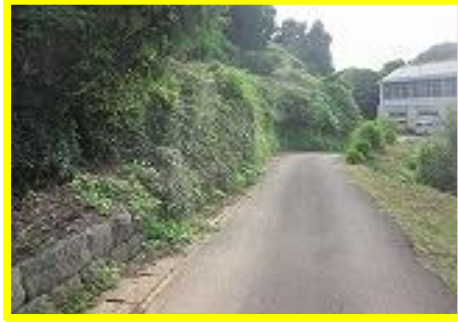
ひどく降ると雨水とともに 山の斜面が崩れている