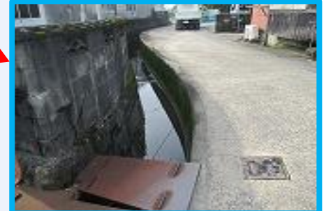
側溝が多く、蓋がしていない