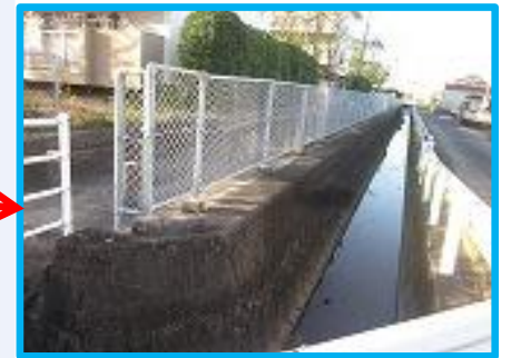
大雨時に水があふれ、通れない。