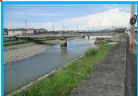
浜川 増水だと浜全体がつかる