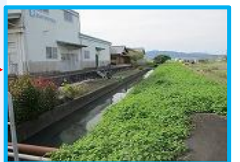
大雨時に川にかかる橋を越えて、水があふれる