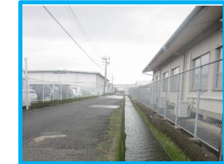
側溝の蓋もなく水があふれる