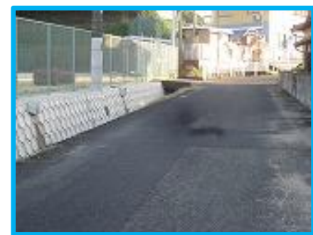
道沿いに川があり、見えにくく、はまりやすい