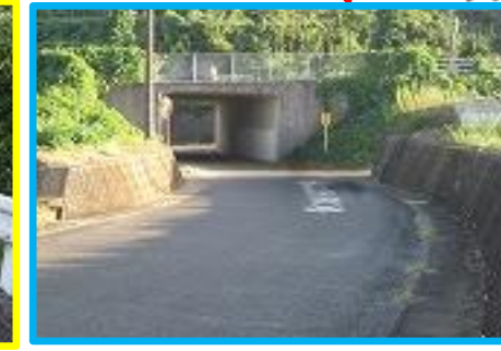
バイパスのトンネルがつかる