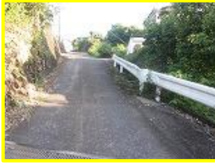
雨の時は川のように坂を流れてくる。