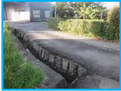
大雨時に川にかかる橋を越えて、 水があふれる。