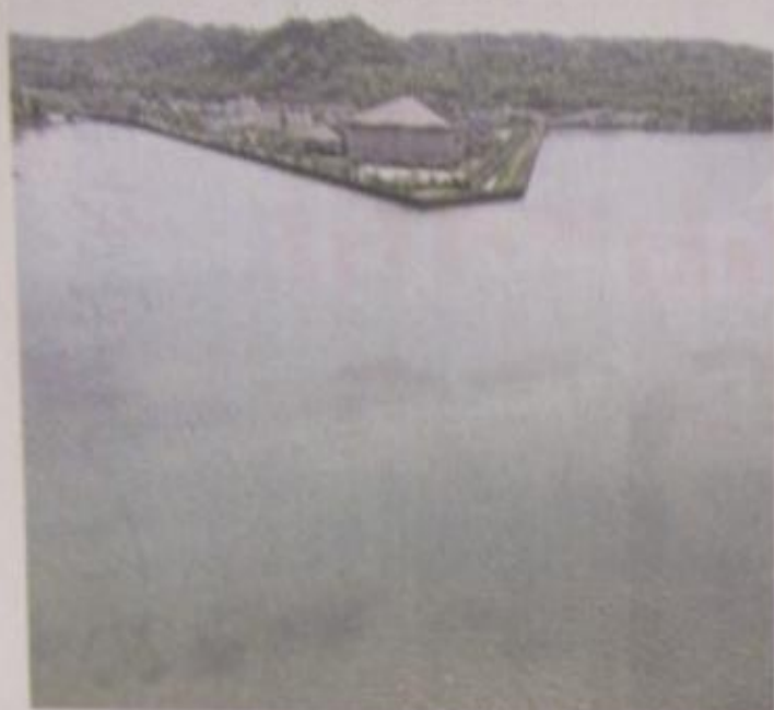
(第三種郵便物認可)