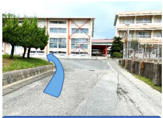
② 体育館の奥へお進みください。