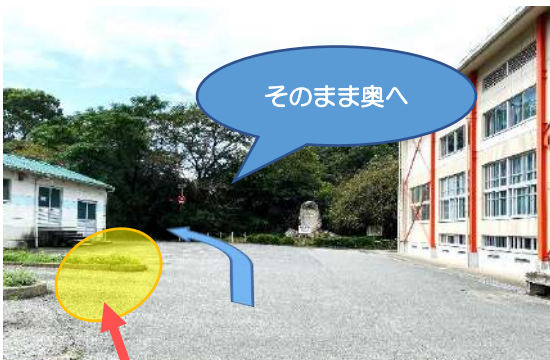
③ ここは駐車禁止です。