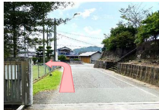
⑧ 左折退出にご協力ください。