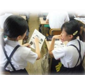
友達との話し合いの様子