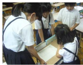
登校班のふり返り