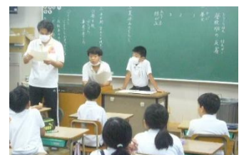
地区長の進行による「地区での生活等ふり返り」