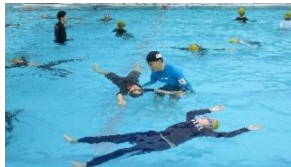
仰向けて浮く練習