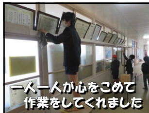
一人一人が心をこめて 作業をしてくださいました