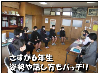
さすが6年生 姿勢や話し方もバッチリ

いつもならば、年度末には6年生の子供たちとグループ別に給食の会食を行うのですが、新型コロナウイルス感染予防のために会食を止め、今年度は、マナー教室という形をとって、一人一人とお話をさせてもらいました。会話の主な内容は、 将来の夢 についてでした。どの子も具体的な姿として将来の夢や憧れの職業などを思い描いており、夢を持つようになった理由や夢の実現のためにこれから何が必要かなどを質問すると、それぞれに自分の考えを聞かせてくれました。卒業前のとても有意義で楽しい時間を過ごすことができ、とても嬉しく思いました。