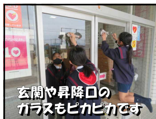
玄関や昇降口の ガラスもピカピカです