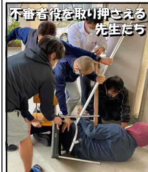
不審者役を取り押さえる先生たち

10/19(月)には、学校に不審者が侵入してきたことを想定して避難訓練を実施しました。教師は避難誘導から不審者を取り押さえるまでの行動を、そして子供たちは校内放送や先生の指示を聞きながら教室で待機するなどし、安全を確保するまでの行動を確認しました。その後、校内放送で、警察の方から、もしも不審者に遭遇したらどうしたらいいかについて「イカのおすし」の合言葉などを例にあげながらお話をしていただきました。お家でもたった一つしかない大切な命の守り方についてぜひ話題にしてください。