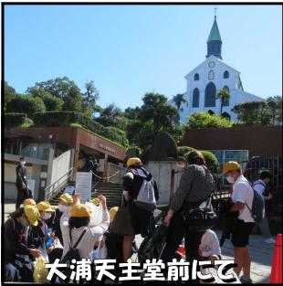
大浦天主堂前にて

修学旅行が無事に終わりました。22日(木)は、あいにくの雨模様でしたが、どの学年もほぼ予定どおりの活動ができ、子供たちはそれぞれにたくさんの学習と思い出ができたようです。コロナ禍の中での実施ということで、例年以上に配慮しなければいけないことも多々ありましたが、生き生きと活動する麓っ子の表情を見ると、やはり実施してよかったと改めて感じたところでした。