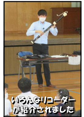
いろんなリコーダーが紹介されました

10/15(木)に、リコーダー協会から講師をお招きし、3年生のリコーダー講習会を実施しました。講師の方のユーモアあるお話と「ドラえもん」や「鬼滅の刃」などの素晴らしい演奏を交えた講習を受けながら、子供たちは目を輝かせ、大小さまざまなリコーダーの種類や基本的な技能について、楽しく学ぶことができました。