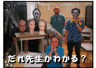
だれ先生かわかる？

学校の先生たちも一教室を担当し脅かし役として参加をさせていただきました。私も一緒に脅かしましたが、子供たちの中には「あっ〇〇先生！」とすぐに見破る子もいて「暗闇なのにさすがよく分かるものだなあ。」と感心させられました。安全面にも十分配慮されたイベントでしたので、私たちも安心して最後まで楽しむことができました。みなさまたいへんお疲れさまでした。