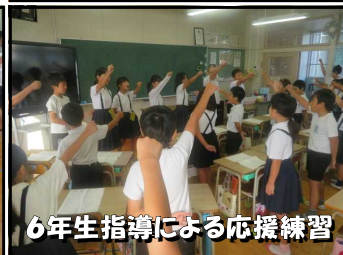
6年生指導による応援練習