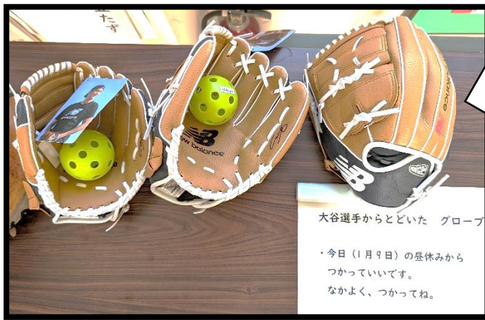
大谷選手からといた グローブ ・今日(1月9日)の昼休みから つかっています。 なかよく、つかってね。

3学期はわずか51日の登校日です(6年生は47日)。子供たちが、次のステップへ向かう準備期間として、一日一日を大切にしながら学校生活を送れるように支援していきたいと思っております。今年もどうぞ、学校教育への御支援と御理解をお願いいたします。