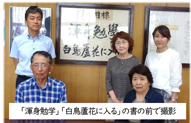
「渾身勉学」「白鳥蘆花に入る」の書の前で撮影

6月5日(金)第1回学校評議員会が行われました。学校評議員会は、地域の意見を学校運営に生かし、「開かれた学校づくり」を進めることを目的として開いているものです。