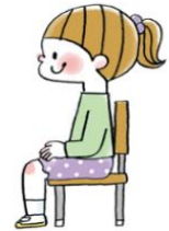
座った状態の 座った状態の