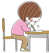
ノートに顔が ノートに顔が