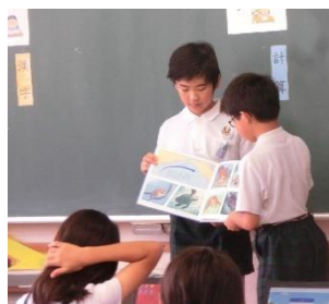
図書委員の読み聞かせ