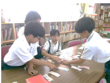
しおりコンテストの審査