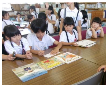
しりとり本さがし