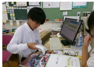
「セルフバコード読み取り」をしているところ

梅雨の時期で外遊びが難しい日も多い中、図書委員の子供たちは昼休みのイベントを企画・運営し、大活躍でした。「しりとり本さがし」や「しおりコンテスト」などに加え「ビンゴくじ」では「セルフぴっ(バーコード読み取りが自分でできる)券」が当たったり、図書委員さん全員とじゃんけんしたら3冊貸出券がもらえたりと楽しい企画が盛りだくさんの図書館祭りとなりました。これからも、本との出会いを大切にしながら、子供たちが読書に親しむ機会を増やしていきたいと思ひます。