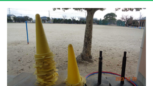
いつも整頓されているコーン