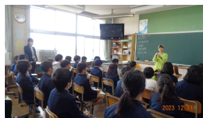
相手への敬意を態度で示す