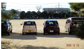
運動場に停めていても安心

また、今月をもって今年度の給食費の徴収が全て終了いたしました。未納0円です！こちらも素晴らしいです！来年度から口座振替に移行します。今後も未納0円を継続できるよう皆様のご協力を切にお願いいたします。口座振替依頼書も20日までに全員の方にご提出いただきましたことを申し添えます！有難いです！