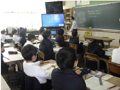
発表をがんばる4年生