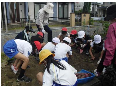
みんなで協力こすもす学級