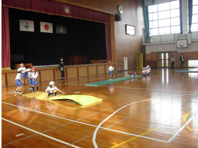
マット遊びの1年生