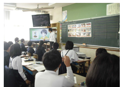
英語を楽しむ6年生