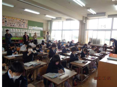
かけ算を暗唱する2年生