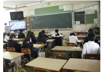
分かれて授業の3年生