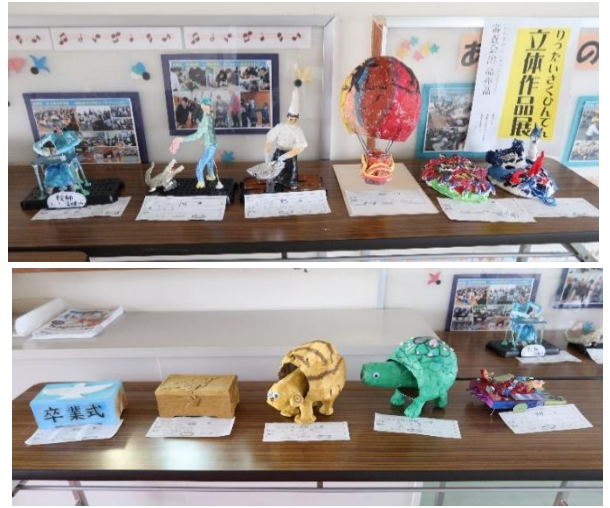
学童美術展入賞作品は、学校の玄関前に7日まで展示していました。