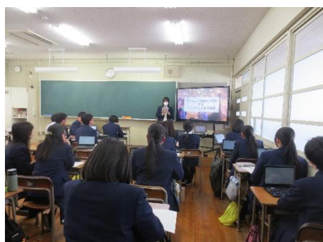
クラス発表の様子