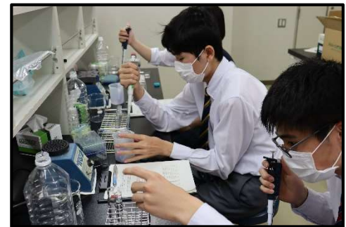
農学分野 (佐賀大学農学部)