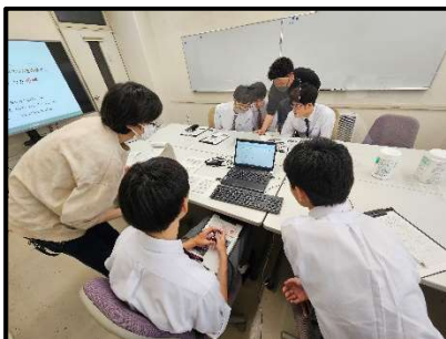
数学・情報分野 (佐賀大学理工学部)