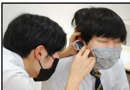
医療系分野 (西九州大学小城キャンパス)