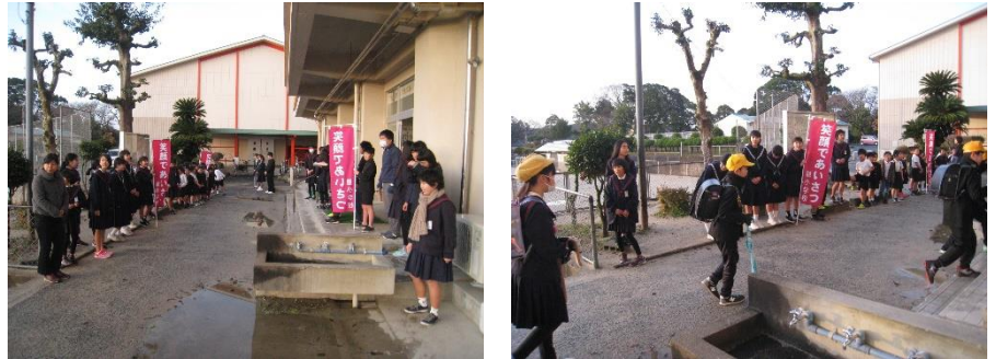
【麓小学校での様子】

今年度2回目ということもあって、中学生と一緒に元気よくあいさつ運動に取り組みました。先輩達が笑顔であいさつをしてくれるので、小学生も自然と笑顔になりました。