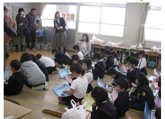
麓小での授業研究会

1月23日（木）には、麓小学校を会場に3校合同の授業研究会を行いました。授業後に、各学年や部会に分かれて協議会をもち、その中で、小学生や中学生の実態について情報交換を行い、よりよい授業づくりについて意見を交流しました。夏休みの研修会が台風で中止になるなど、計画よりもあまり取り組めないこともありましたが、鳥栖西中学校、旭小学校、麓小学校の教職員が、児童生徒の学力向上に向けて、一緒に研修をしたり情報を共有したりすることで「小中一貫教育」を具体的に進めることができています。