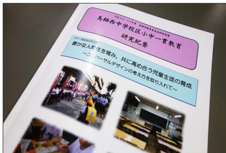
2年間の実践を集積した『研究紀要』

次年度以降も、この2年間の課題を精査し克服しながら研究の成果をより確かなものにしていきたいと考えております。保護者の皆様には今後も一層のご支援を賜りますようお願い申し上げます。