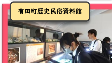
有田町歴史民俗資料館