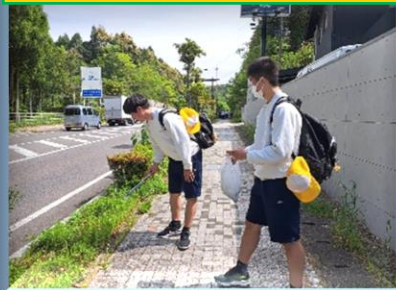
4月/歓迎遠足の帰りの 清掃活動