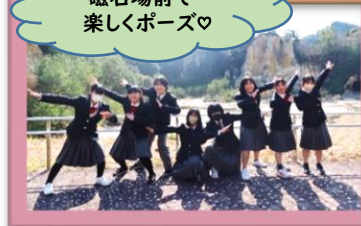
磁石場前で 楽しくポーズ♡