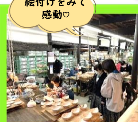
熟練された 絵付けをみて 感動♡