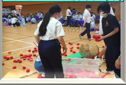
6月/インターアクト部 「障がい者支援施設の ファミリーフェスタあすなろに参加」