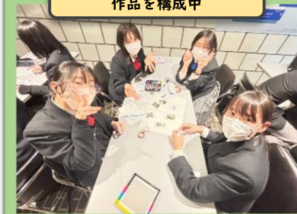
九州陶磁文化館で 作品を構成中