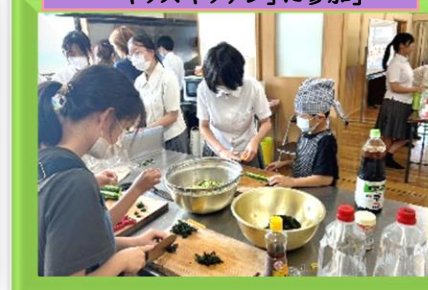
9月/インターアクト部 「キッズキッチン」に参加