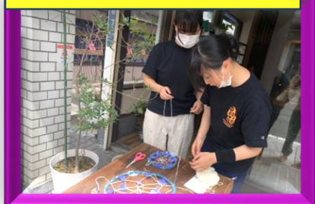
8月/デザイン科 「有田ウインドウディスプレイ甲子園」