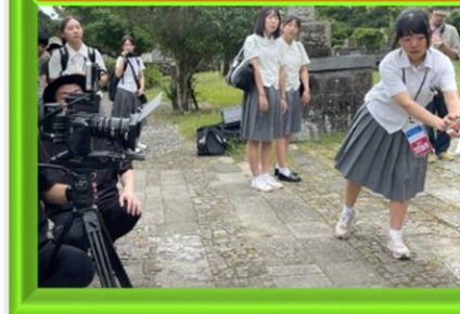
8月/デザイン科3年生課題研究 「有田町が舞台の映画撮影」