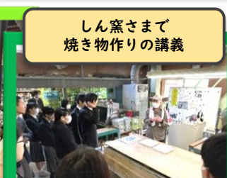
しん窯さまで 焼き物作りの講義