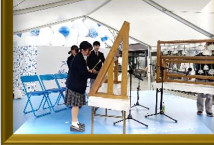
12月/吹奏楽部 アリタセラのクリスマスイベントで演奏