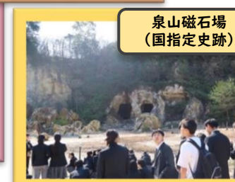
泉山磁石場 (国指定史跡)