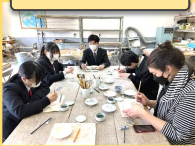
徳永陶磁器さまで絵付け体験