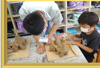
6月/セラミック科 「有田町内小学校で陶芸交流授業」