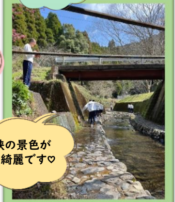
竜門峡の景色が とても綺麗です♡