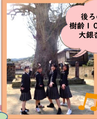
後ろの木は 樹齢1000年の 大銀杏です♡