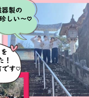
陶磁器製の 鳥居が珍しい〜♡