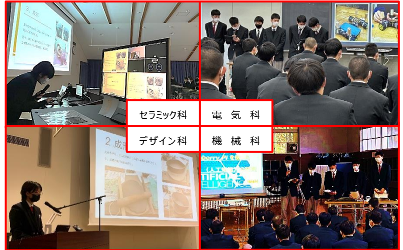
各科の課題研究発表会の様子

2月3日(木)4時間目に実施される全校課題研究発表会では、この発表会で選ばれた各科代表の研究班が発表します。各々が創意工夫を凝らして取り組んだ内容に自信をもって発表して欲しいです。