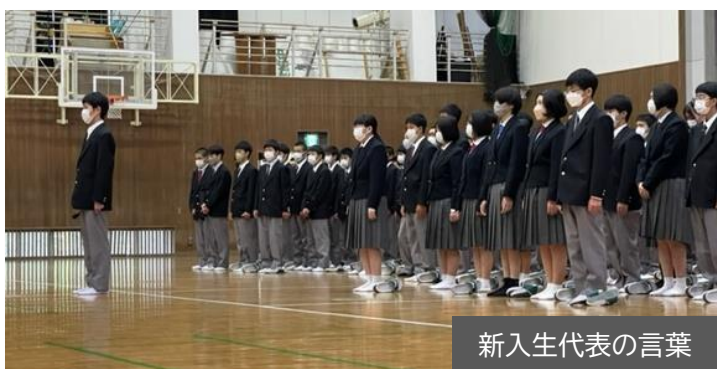
新入生代表の言葉