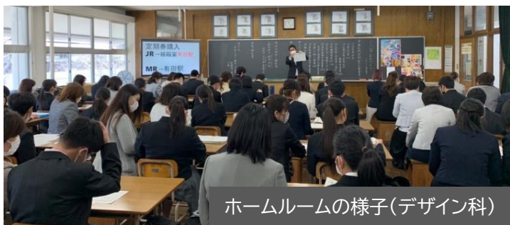
ホームルームの様子(デザイン科)

これからの高校生活が充実した実りあるものになることを期待しています。2・3年生のみなさんは、上級生としての手本となる姿をぜひ示していきましょう！