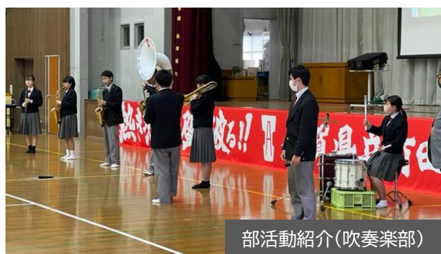
部活動紹介(吹奏楽部)