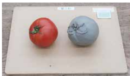
特別選抜試験課題(課題例)

●セラミック科は、特別選抜試験で美術実技試験(粘土による立体物の再現(模刻))を行います。