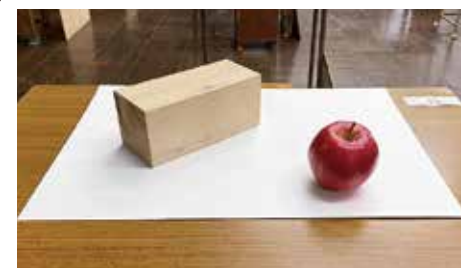
特別選抜試験課題(課題例)