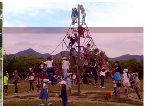
【写真④ 遊具で遊ぶ児童】