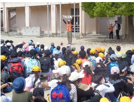
【写真② 出発前の安全指導】

昨年度までは、各種行事等、中止ばかりでしたが、感染対策を十分行いながらできたことは、大変良かったと思います。今年度の今後の行事等については、できる限り実施していきたいと考えています。