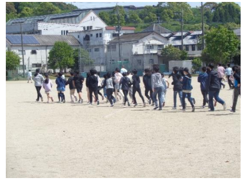
【写真① しゃべらずに避難する児童】

「万が一」「命を最優先に」を児童にしっかり伝え、緊急時に落ち着いて対応、行動できる有田中部小学校の子どもたちであってほしいと考えたところです。