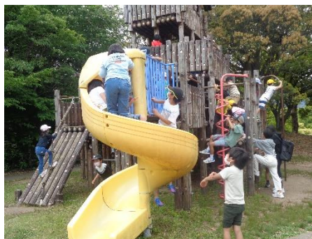
【写真③ 遊具で遊ぶ児童】